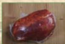
1/2 palette fumée