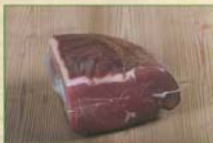
Coeur de Jambon cru