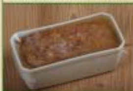
Pâté aux morilles