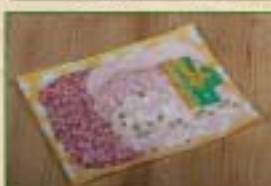
Assiette de Charcuterie