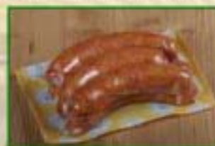
Saucisse de Montbéliard Sous-vide par 6 pièces