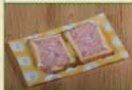
Pâté en croûte SV X 2 T