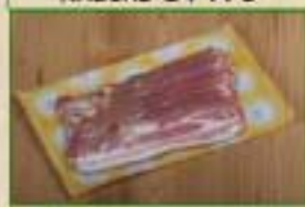
Poitrine fumée tranchée