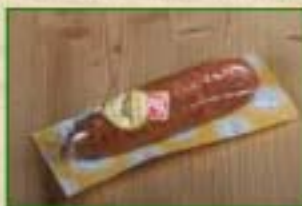
Saucisse de Morteau Label Rouge Sous-vide par 1 pièce