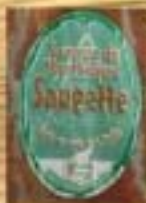
Saucisse de Montbéliard Saugette