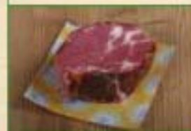
Echine fumée 500g