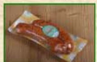
Saucisse de Montbéliard Sous-vide par 2,5 kg