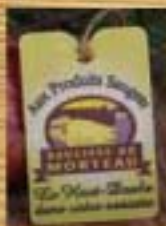
Saucisse de Morteau CCP