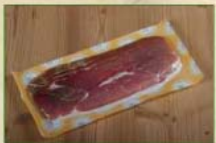
Jambon cru fumé SV X 6 T