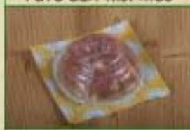
Bol de fromage de tête