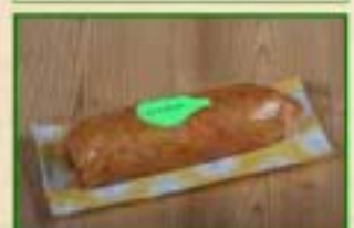
Saucisse au choux fumée Sous-vide par 2,5 kg

Morteau de bronze Label Rouge 2008 - Morteau d'or Label Rouge 2007 Morteau d'or 2006-2003-1998-Morteau d'argent 2004