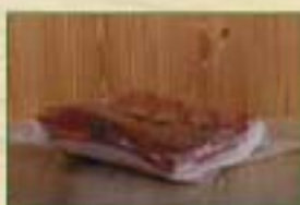
1/2 poitrine fumée