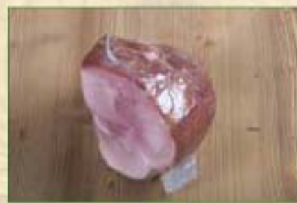
1/4 de Jambon cuit fumé