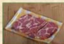
Echine fumée SV X 3T