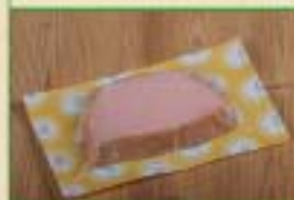
Pâté de foie