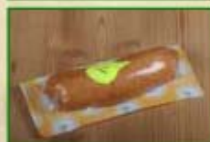
Saucisse au Comté fumée Sous-vide par 2,5 kg