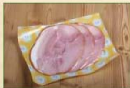
Jambon fumé cuit SV X 3 T