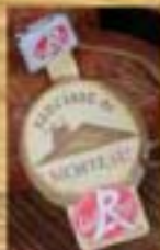
Saucisse de Morteau Label Rouge