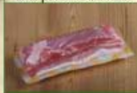
Poitrine 1/2 sel SV x 350g