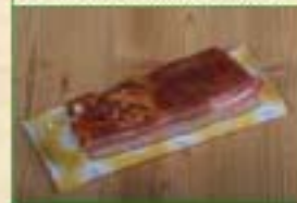
Poitrine fumée SV x 350g