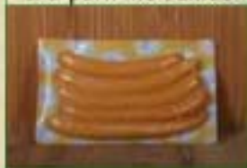
Knacks SV X 5