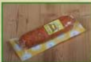
Saucisse de Morteau CCP Sous-vide par 1 pièce