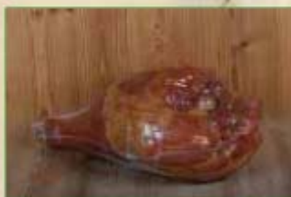
Jambon cuit à l'os fumé