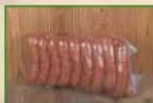
Saucisse de Montbéliard Sous-vide par 2,5 kg