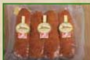
Saucisse de Morteau Label Rouge Sous-vide par 4 pièces