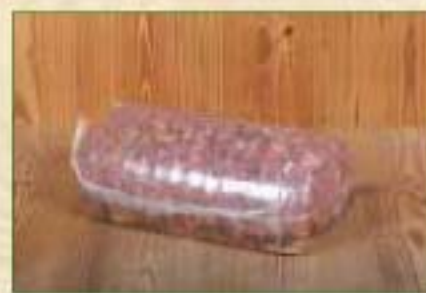
Fromage de tête