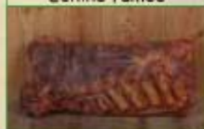
Poitrine fumée vrac