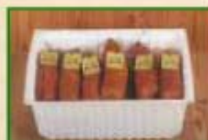
Saucisse de Morteau CCP Sous-gaz par 5 kg

Morteau de bronze Label Rouge 2008 - Morteau d'or Label Rouge 2007