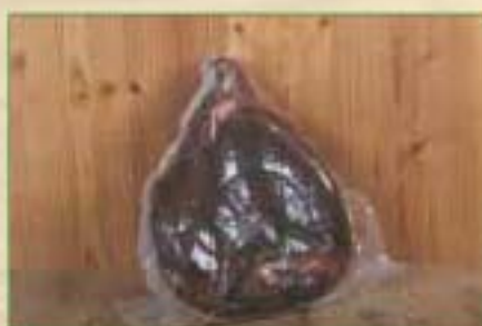
Jambon cru reconstitué fumé