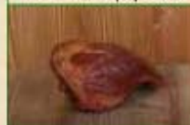
1/2 palette vrac