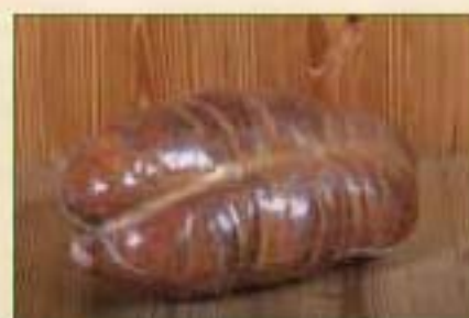
Jésus cuit fumé