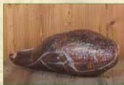
Jambon gougé cuit fumé