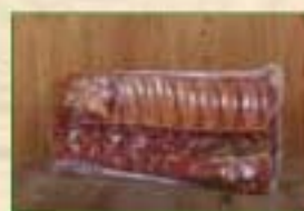
Carré de côte fumé