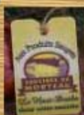
Saucisse de Morteau CCP