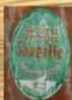
Saucisse de Montbéliard Saugette