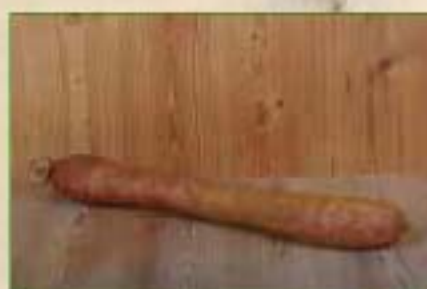
Grand fuseau fumé