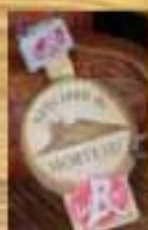
Saucisse de Morteau Label Rouge