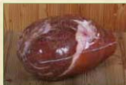
Jambon fumé cuit dans le Haut Doubs (supérieur)