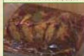
1/2 Poitrine paysanne