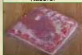
1/2 Poitrine 1/2 sel